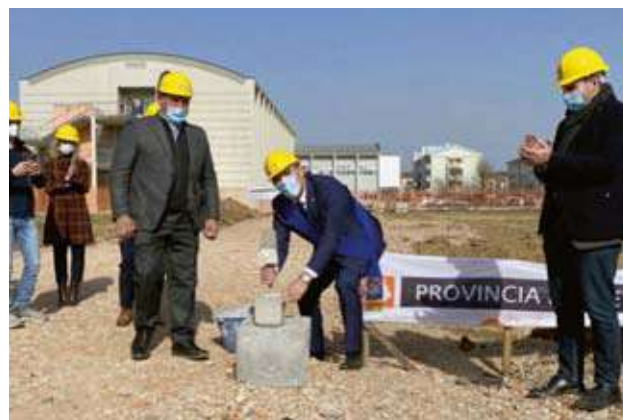
Nella foto: dalla posa della prima pietra all'inaugurazione.

Si tratta di un'opera importante sia a servizio della scuola che per attività extrascolastiche. Infatti, la tribuna contiene 368 posti ed è omologata dal Coni per gare nazionali . I lavori si sono svolti in tempi ridotti, appena 230 giorni per un'opera attesa da diversi anni.