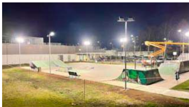
Nella foto l'area da skate board.

dotare l'area di una adeguata illuminazione notturna e di emergenza. L'impianto è stato progettato con criteri di risparmio energetico e di contenimento dell'inquinamento luminoso. Questo importante intervento di riqualificazione, per una spesa complessiva di circa Euro 45.000,00, ha portato a un maggiore godimento dell'area soprattutto da parte dei giovani che praticano questa disciplina.