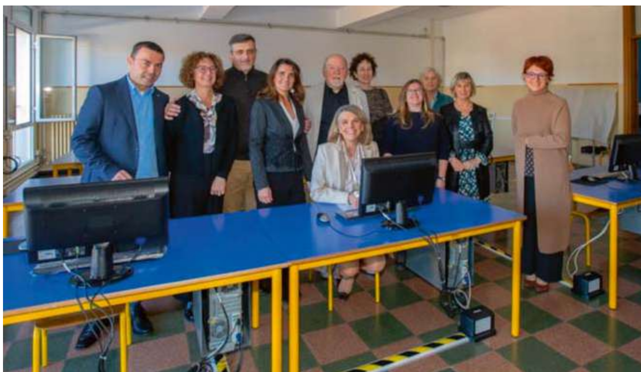
Inaugurazione della nuova sede di Castelfranco Veneto del CPIA "Alberto Manzi" di Treviso

Fin da subito, in collaborazione con la Provincia, è stato approntato un piano straordinario di riordino delle scuole cittadine, liberando gli spazi occupati dalle scuole superiori nelle sedi delle Medie di Treville e Giorgione e riadattando, con interventi straordinari di manutenzione ulteriori spazi presso tutti i diversi plessi. La Provincia, in tempo record, ha realizzato la nuova succursale dell'Istituto Maffioli in un'ala dell'ospedale vecchio. Il Comune, a seguito dell'accorpamento della primaria Colombo con la Sarto, ha liberato spazi per il Liceo Giorgione ma soprattutto ha realizzato la miglior sede di tutta la Provincia del centro per l'educazione degli adulti (CPIA) assegnando gli spazi al primo piano dell'ex scuola Colombo. Questo impegno di miglioramento continua, sia come interventi di manutenzione