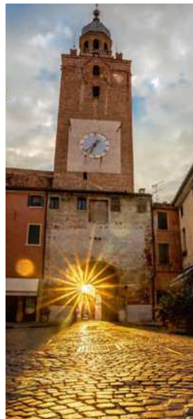
Nella foto Casa del Trombetta e Torre civica.

È in fase di realizzazione anche il progetto per il recupero della Casa del Giardiniere, situata in prossimità della Torre di sud-est.