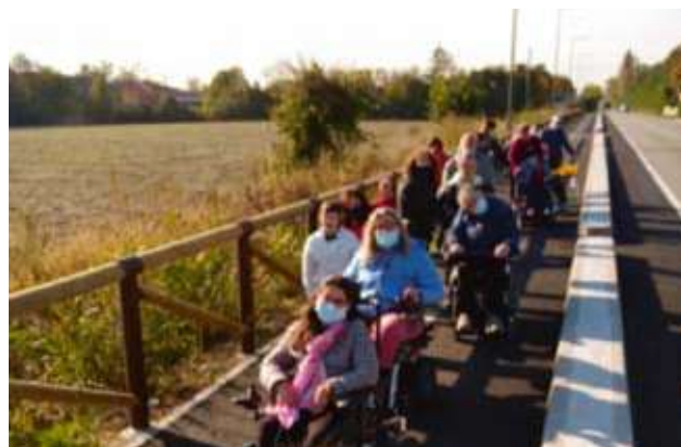
Nella foto un tratto della pista ciclabile.

In concomitanza ai lavori di estensione della rete di fognatura nera in via Postioma da parte della Ditta A.T.S. Alto Trevigiano Servizi srl, con Accordo di Programma il Comune ha inteso realizzare un percorso ciclopedonale lungo la Postumia Romana nel medesimo tratto di posa della fognatura, ovvero dalla rotatoria all'intersezione della stessa con la S.P. n.667 a Sud di Vallà di Riese Pio X, fermata dei mezzi pubblici di linea, sino all'accesso del Centro Atlantis. L'obiettivo principale di tale opera è stato quello di mettere in sicurezza il transito ciclabile e di collegare gli utenti del Centro sociale Atlantis e gli altri utenti interessati, alla pista ciclabile di Via San Pio X. I lavori hanno consentito di allargare la strada di circa 5 metri compresa pista ciclopedonale e fossato: si è così