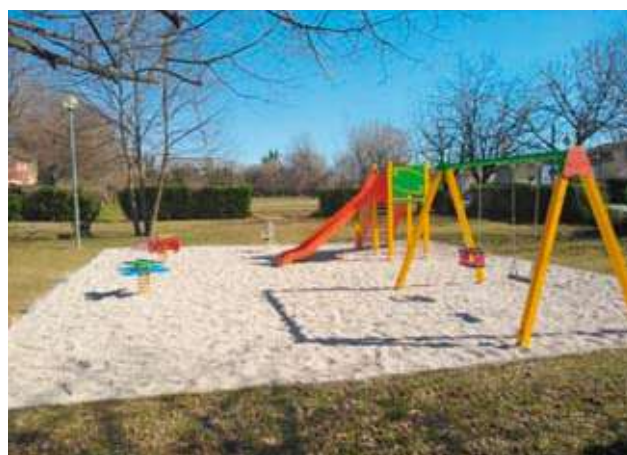
Nella foto un'area verde parco gioco.

La volontà dell'Amministrazione Comunale è quella di intervenire al fine di migliorare, sostituire e rinnovare le attrezzature ludiche presenti, per garantire ai cittadini di utilizzare e vivere al meglio le aree verdi comunali.