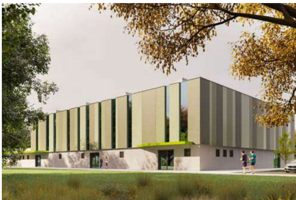
Nella foto: progetto finale.