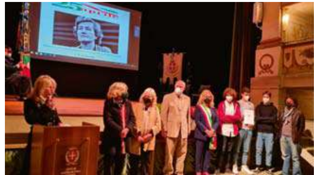
Cerimonia di premiazione del concorso del 25 aprile per gli alunni delle scuole cittadine

È ripartito il concorso per le scuole del 25 aprile che quest'anno è stato intitolato alla nostra illustre cittadina Tina Anselmi e che ha visto una straordinaria partecipazione delle scuole. Significativa ed emozionante la premiazione al Teatro Accademico dei diversi componimenti, disegni e contenuti multimediali.