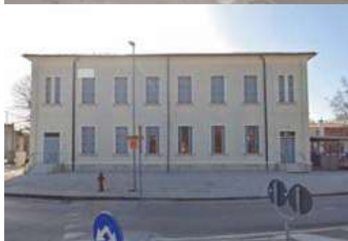
FOTO: l'edificio ristrutturato, prima e dopo i lavori.

Si sono conclusi anche i lavori di ristrutturazione delle ex scuole elementari di Treville svolti in due stralci: il primo con sistemazione del piano terra, del tetto, adeguamento sismico, nuovi serramenti, nuova impiantistica termoidraulica ed elettrica e allestimento della mensa scolastica; il secondo con la sistemazione del piano primo, allestimento sala civica con adeguamento norme barriere architettoniche e la sistemazione delle facciate e delle finestre del piano primo.