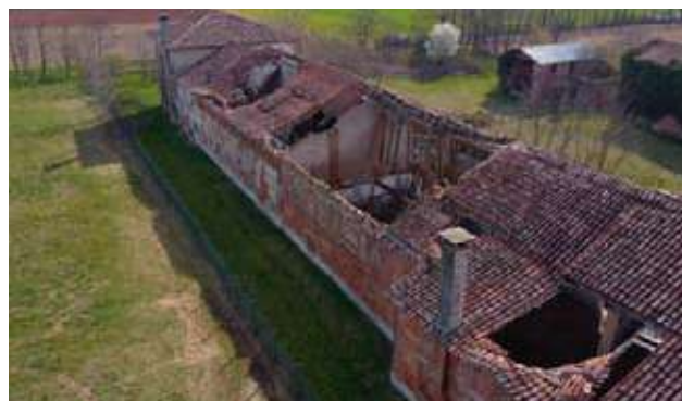
Nella foto lo stato attuale della ex Casa Cattani.

Il costo totale degli interventi descritti è pari a Euro 1.115.000,00 e il procedimento attuativo è in atto.