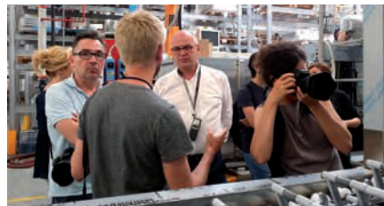
La visita con gli artisti allo stabilimento DIHR

tati dell'esperienza si vedranno nei prossimi mesi attraverso una serie