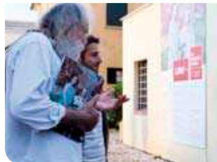
Un momento dell'inaugurazione della Mostra Fotografica LNM 10

Museo inteso come casa aperta, ai cittadini così come ad altre associazioni, dal Conservatorio agli Amici dei Musei, con una serie regolare di eventi, concerti, conferenze in primis. All'interno delle sale del Museo, due le iniziative importanti. Una mostra fotografica "LNM 10 - Fotografi in residenza", descritta in altra pagina, e una di pittura "Eros Florale, 10", con cui il noto artista cittadino, Lorenzo Viola, ha voluto ricordare i suoi 60 anni di attività tra tele, pennelli e non solo. Di particolare valore il ciclo di conferenze "Le Macchine del tempo", dedicata a un tour virtuale entro i principali Musei della Regione, grazie alla testimonianza dei loro Direttori.