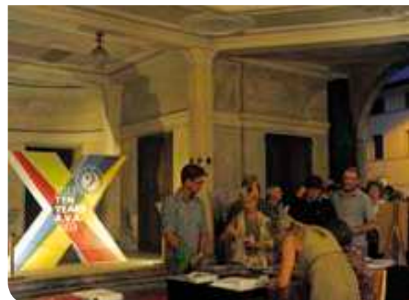
Uno dei tanti momenti delle serate in Villa

Entro l'inverno, tra l'altro, dovrebbe venire anche inaugurata la sede provvisoria del Centro del Restauro entro alcuni locali della Villa, grazie all'intervento di un primario (e storico) istituto bancario cittadino.