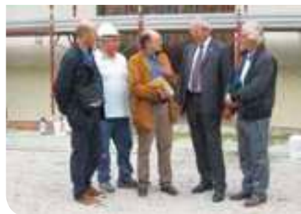
Il restauro delle scuderie

Se il Parco, quindi, è precluso ora al pubblico, in quanto già sono iniziati i lavori, quest'estate è stato ancora possibile usufruire dei due cortili interni della Villa, nonché del prestigio-