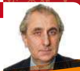
GIANCARLO SARAN Assessore alla cultura, al turismo, all'identità veneta

Altro importante tassello a testimonianza dell'impegno profuso da diversi interlocutori per il recupero dell'intero compendio, il restauro delle antiche Scuderie, grazie ad una sinergia tra l'Amministrazione comunale (che si è fatta carico di mettere in sicurezza gli interni), il Rotary Club di Castelfranco-Asolo e la Conartigianato della castellana, che ha riportato all'antico splendore gli intonaci della facciata sud.