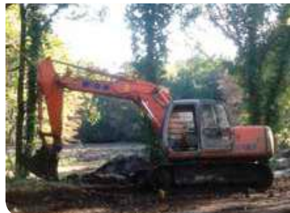
Nel parco si lavora e come si lavora!

Un'ulteriore tappa di una serie di interventi che, nell'estate del 2015, dovrebbero restituire alla Città una delle sue ricchezze più amate.