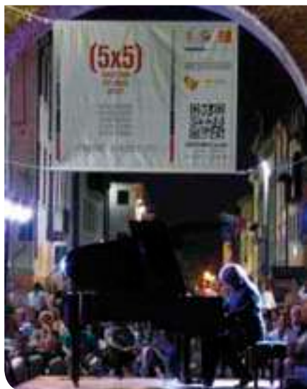
Una delle serate estive sotto la Torre civica