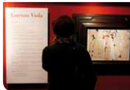
Grande successo della Mostra dedicata al pittore Lorenzo Viola, con un boom di oltre 1300 bambini iscritti ai laboratori scolastici

Dal Museo civico di Bassano a quello di Verona, passando per la Gipsoteca del Canova e altre istituzioni veneziane e non. Un Museo, quindi, grazie anche alla regia del suo direttore Luca Baldin, sempre più proiettato ad essere protagonista e indispensabile interlocutore per lo sviluppo di una Città, quale Castelfranco Veneto, nel cui dna, da sempre, albergano punti di forza strategici, ma sinora mai valorizzati a sistema, sul piano del patrimonio storico e delle relative potenzialità di attrazione turistica conseguenti.