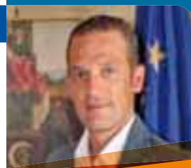
GIANLUCA DIDONÈ Assessore allo Sport e alle Associazioni di Volontariato