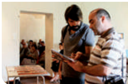
Grande successo per la presentazione della Guida de "Il Duomo"