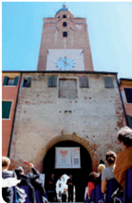
L'inaugurazione della Mostra "5x5" entro la Torre Civica

La Campagna per la salvaguardia delle Mura cittadine procede, cambiando passo. In questi mesi si è puntato molto sulla informazione, sulla sensibilizzazione della cittadinanza, del mondo associativo. I risultati sono concreti. Oltre 12.000 firme. Una rassegna stampa di oltre un centinaio di articoli. Diversi servizi televisivi. Ora si sta lavorando su due binari. Da un lato la massima valorizzazione della Torre Civica, recentemente restaurata. A metà maggio