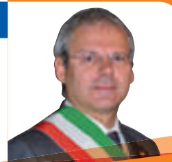
On. LUCIANO DUSSIN Sindaco

Ci risiamo, lo stato di abbandono e privazione che subiscono i Comuni non ha tregua. Il bilancio di previsione 2013 dovrebbe essere stato approvato entro la fine del 2012, iniziandone l'iter verso fine settembre dello scorso anno. Invece ci troviamo ancora senza una previsione di spesa a metà anno in corso. È come se in azienda ci si trovasse a metà anno ormai trascorso, senza aver potuto programmare nulla, e nell'incertezza assoluta di cosa poter fare da qui a dicembre... sarebbe il fallimento. Il Governo ha prorogato a fine settembre l'approvazione di questi bilanci comunali, perchè ha ancora bisogno di tempo per saperci dire che fine farà la riforma dell'IMU e in che quantità sarà distribuita agli enti locali, della TARSU, come saranno distribuiti i 2,3 miliardi di euro di nuovi tagli ai Comuni per il corrente anno. Nel frattempo la vera riforma dello Stato in termini di "Spesa Standard" non si muove, quindi non aspettiamoci nulla di nuovo: lo Stato spenderà troppo, male, e i territori virtuosi come il nostro continueranno ad essere "risucchiati" nel fallimento generale.