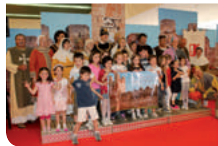
Il Concorso per le scuole elementari, con tema la salvaguardia delle Mura, ha visto premiata la Classe II A di Salvarosa