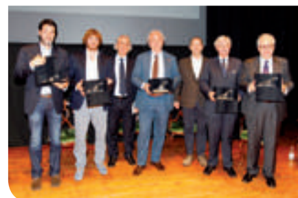
I vincitori del Premio Giorgio Lago 2013

Grande successo anche per il Premio Nina Scapinello, organizzato dalla Compagnia Guido Negri e dal locale Lions Club, che ha premiato i migliori lavori originali in lingua veneta per tenere viva l'opera dell'indimenticabile Nina nel decennale della scomparsa. In vista dei lavori di restauro di Parco e Villa, anche Bolasco è protagonista dell'estate cittadina. La terza edizione di "Bolasco dipinge" ha ospitato l'Associazione dei pittori rosatesi, cui è seguita una importante mostra di scultura di un giovane trevigiano che farà sicuramente strada, Giovanni Pietrobon con "Donne, donne, eterni dei", in cui la fonte di ispirazione, oltre all'universo femminile, è stato l'affascinante mondo della Lirica.