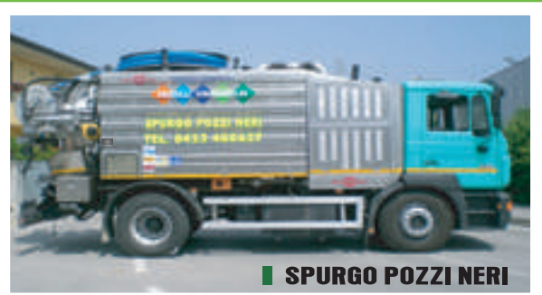
■ SPURGO POZZI NERI