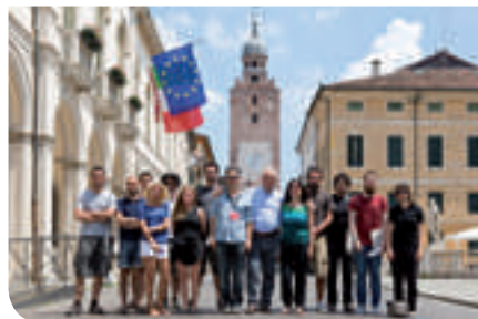
L'Assessore Saran con gli undici fotografi venuti cinque giorni a Castellana Grotte per la salvaguardia delle Mura

Sul versante della comunicazione, invece, a fine Giugno si è svolto "LNM 10",