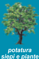
potatura siepi e piante