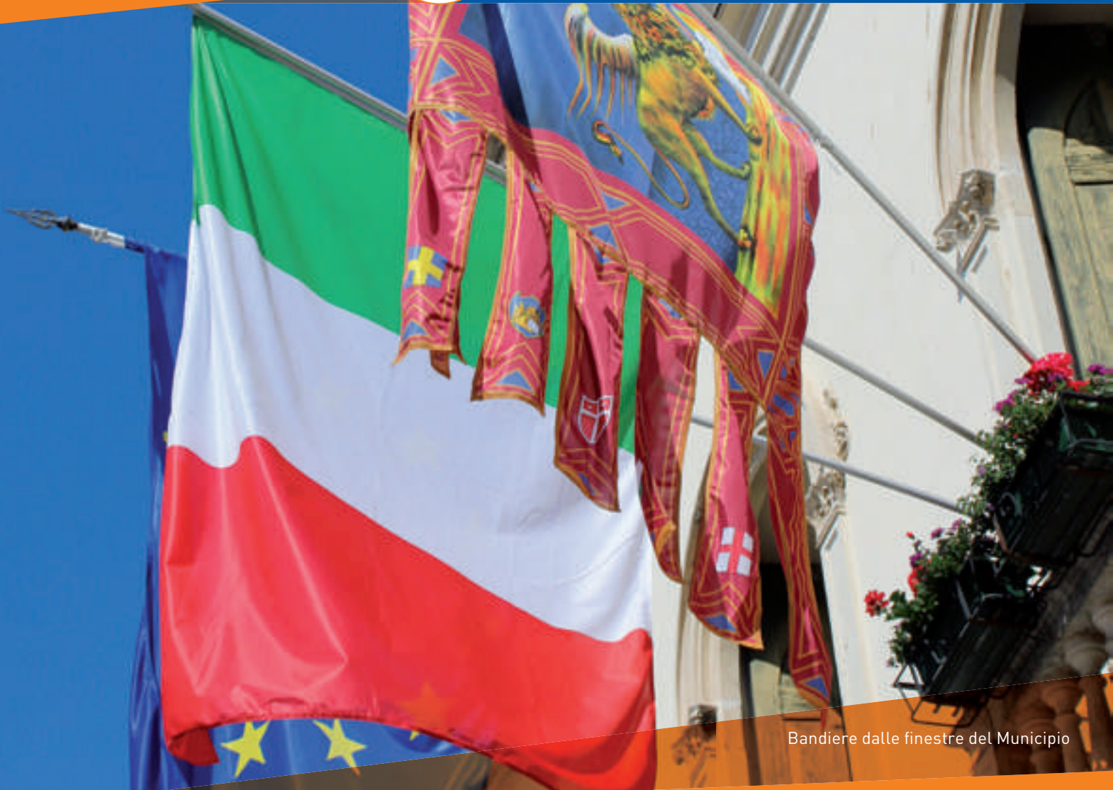
Bandiere dalle finestre del Municipio

SEMESTRALE D'INFORMAZIONE DEL COMUNE DI CASTELFRANCO V.TO