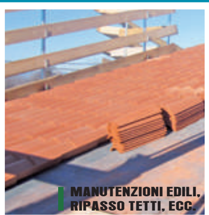
■ MANUTENZIONI EDILI, RIPASSO TETTI, ECC.