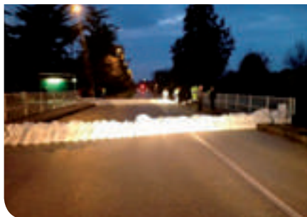
La piena del Muson

Con l'applicazione dello stesso Regolamento, mediante avviso ai proprietari ad eseguire i lavori prescritti, nelle zone dove si è intervenuto, sono state definitivamente risolte le problematiche inerenti gli allagamenti sia delle strade pubbliche che delle proprietà private con la piena collaborazione da parte dei cittadini coinvolti. Altri interventi sono in corso di procedura e l'Amministrazione comunale confida nella più ampia collaborazione da parte dei cittadini per la risoluzione di tale problematiche che significa più sicurezza sulle strade, minori costi pubblici ed evidenti ripercussioni positive per l'ambiente in generale.